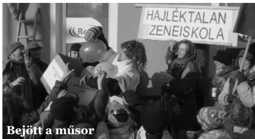
Bejött a műsor